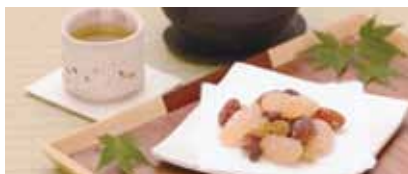
しっとりと仕上げた甘納豆。 じっくりと時間をかけて、丁寧に炊き上げます。

実績 専門卒 平成28年度 — /平成29年度1名 中途 平成28年度3名 /平成29年度7名