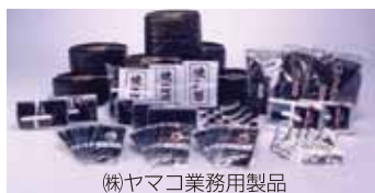
(株)ヤマコ業務用製品

実績 大卒 平成28年度 2名/平成29年度 2名 高卒 平成28年度10名/平成29年度14名 <採用実績校> 九州大学、福岡大学、福岡工業大学、佐賀大学、 西九州大学、崇城大学、熊本学園大学