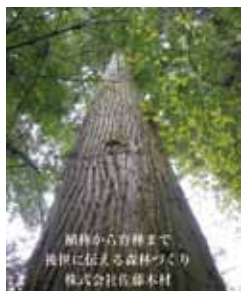
開拓から育種まで 後世に伝える森林づくり 株式会社佐藤木材

映画「wood job」で脚光を浴びた林業。弊社は林業とは少し異なりますが、森林所有者から数十年・数百年育てられた立木を購入し、伐採・搬出した木材を、工務店や製材所などへ納めます。伐採した後の森林は、植林と下草刈りを行って、数十年後再び子孫が、愛情が詰まって育った木材を使用できる環境を整えています。また、平成27年より本社近くに製材部を構え、NPOや地域の職人の皆さんと力を合わせて実施している、住宅づくりに必要となる特殊な建築用の木材を製材しています。「どう育てたら価値のある木材になるか」「どう伐採したらこの木が喜ぶ使い方がなされるか」「将来のために価値のある森林づくりとは」など、一次産業は体力だけでなく、思考力・知力も求められる産業です。日本の森林(もり)づくりに貢献できる仕事と一緒に取り組める仲間を募集しています。