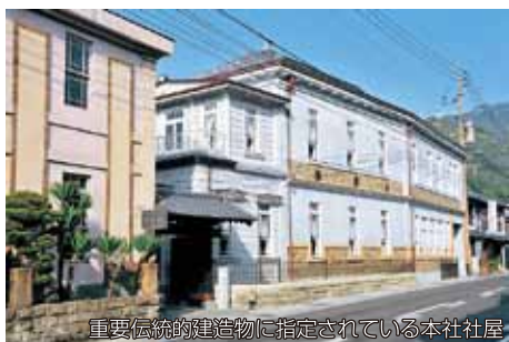
重要伝統的建造物に指定されている本社工屋

明治初期に開催された米国フィラデルフィア万国博覧会への出品を目的として設立された九州で最初の法人です。香蘭社様式と呼ばれる超絶技巧の陶磁器は、欧米で開催された万博で多数の名誉金牌を受賞。海外でもその評価を高めるとともに、宮内省御用達の栄にも浴し、現在に至っています。同じく明治初期、工部省電信局の要請により、我が国で初めて磁器製碍子の製造に成功し、電力の安定供給を通じて日本の近代化に貢献。現在は電力会社や鉄道会社に製品を納入しています。その後、ファインセラミックス事業にも参入し、美術品、碍子とともに経営の三本柱となっています。