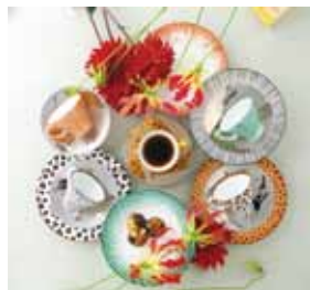
アニマルシリーズの カップとケーキ皿

実績 大卒 平成28年度 1名/平成29年度1名 高卒 平成28年度 1名/平成29年度1名 中途 平成28年度12名/平成29年度8名