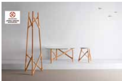
GOOD DESIGN AWARD JAPANESE FURNITURE SELECTION 2015

実績 高専卒 平成28年度 — /平成29年度1名 中途 平成28年度4名 /平成29年度4名