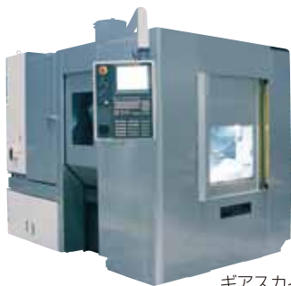
ギアスカイピングマシン

IOT、AMなどの最新技術が開発される時代に伍して、特にギアテクノロジーの開発に力を入れています。最新のギアスカイピング技術で世界レベルにキャッチアップしつつ更にその先の最先端を目指しています。このように絶え間なく高いレベルの新製品に挑戦する体制を有しています。