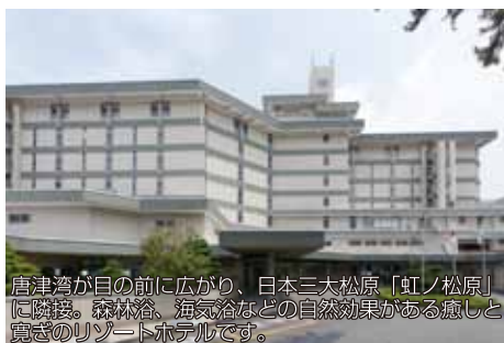
唐津湾が目の前に広がり、日本三大松原「虹ノ松原」に隣接。森林浴、海気浴などの自然効果がある癒しと寛ぎのリゾートホテルです。

ホテル・リゾート事業の一つである唐津シーサイドホテルは雄大な唐津湾と日本三大松原「虹の松原」に隣接する癒しと寛ぎのホテルです。美しい海と大自然に囲まれた好立地が人気で人々に愛され続けています。福岡空港や博多駅からのアクセスも良く、風光明媚なロケーションと相まって、各界の著名人や外国人のお客様にも多くご利用いただいている唐津を代表する歴史のあるホテルです。