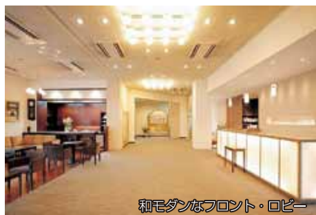
和モダンなフロント・ロビー

「天然温泉かけ流しの展望露天風呂」「安心・安全・佐賀県産食材の会席料理」「まごころのおもてなし」でお客様をお迎えし、また利用して頂ける宿泊施設を目指しております。