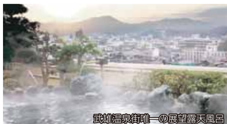
武雄温泉街唯一の展望露天風呂

実績 高卒 平成28年度2名/平成29年度— (採用実績) 杵島商業高校、佐賀農業高校