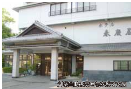
創業当時の雰囲気を残す玄関